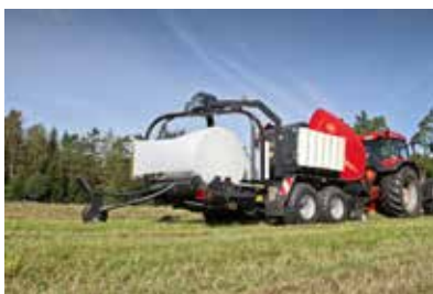
Vicon RF4325 FlexiWrap