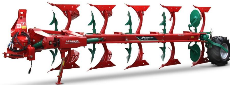
Kverneland 2501 S i-Plough

05.10.2022 Castiglione delle Stiviere (MN), Italia