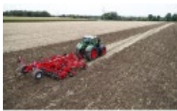
1 Kverneland Enduro Pro T