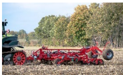
2 Kverneland-Enduro-Pro T