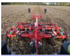
4 Kverneland Enduro Pro T