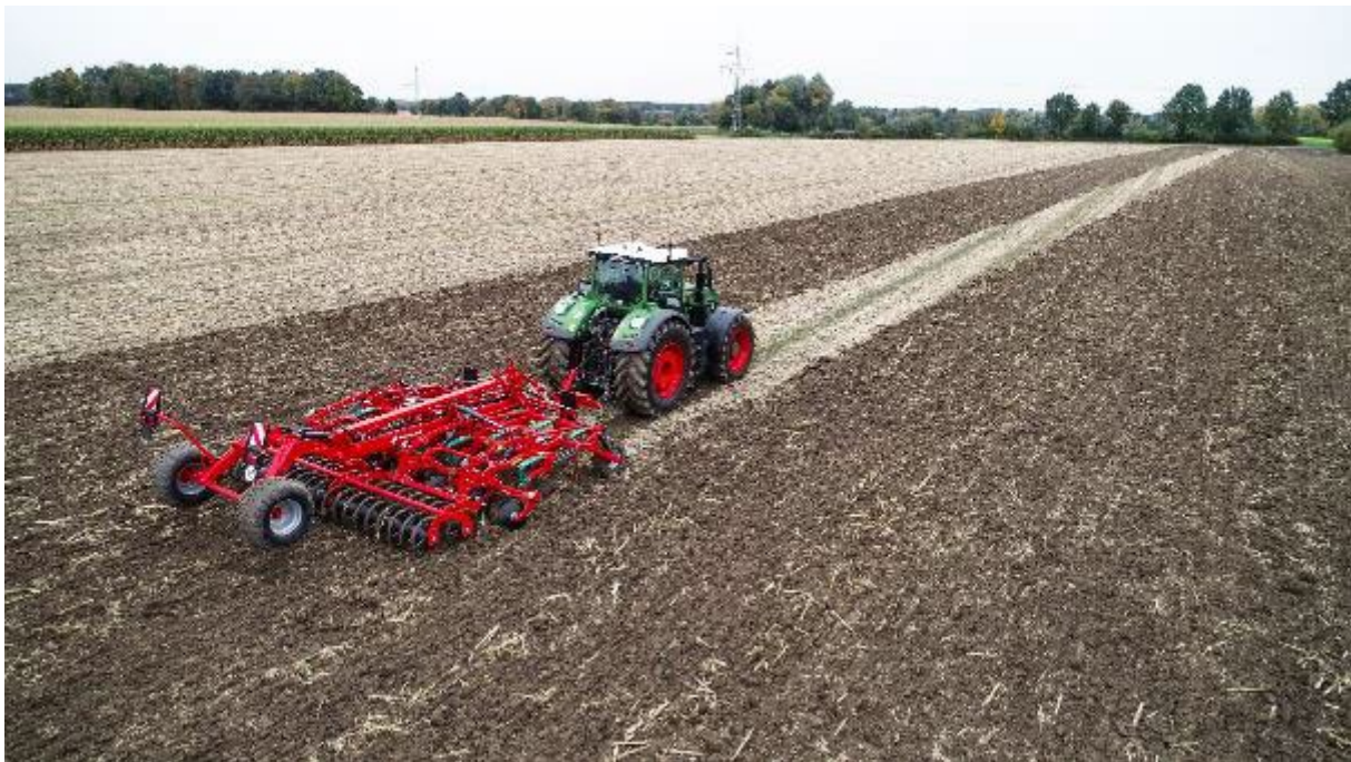
Kverneland Enduro Pro T

05.10.2022 Castiglione Delle Stiviere (MN); Italia