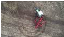
3 Kverneland Enduro Pro T